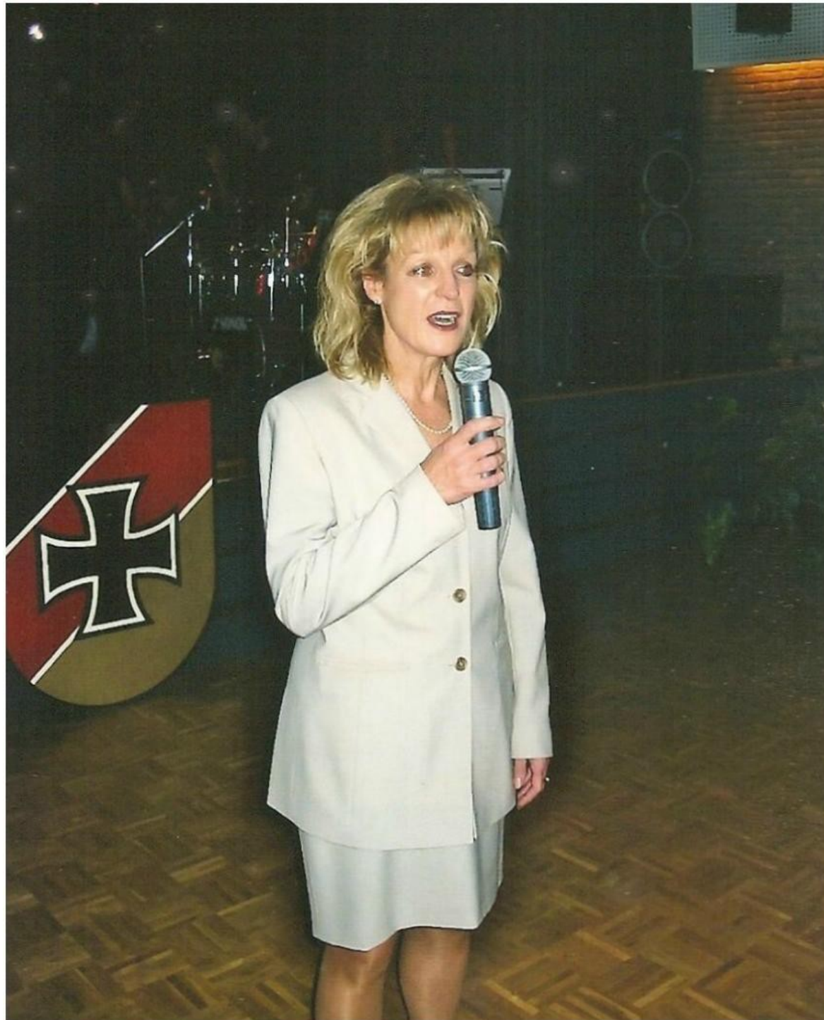
Ratsfrau Dorothea Stelljes hält ein Grußwort für die Stadt Delmenhorst