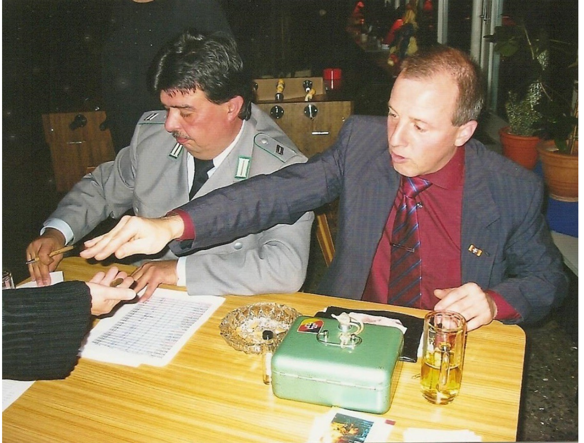
An der Abendkasse