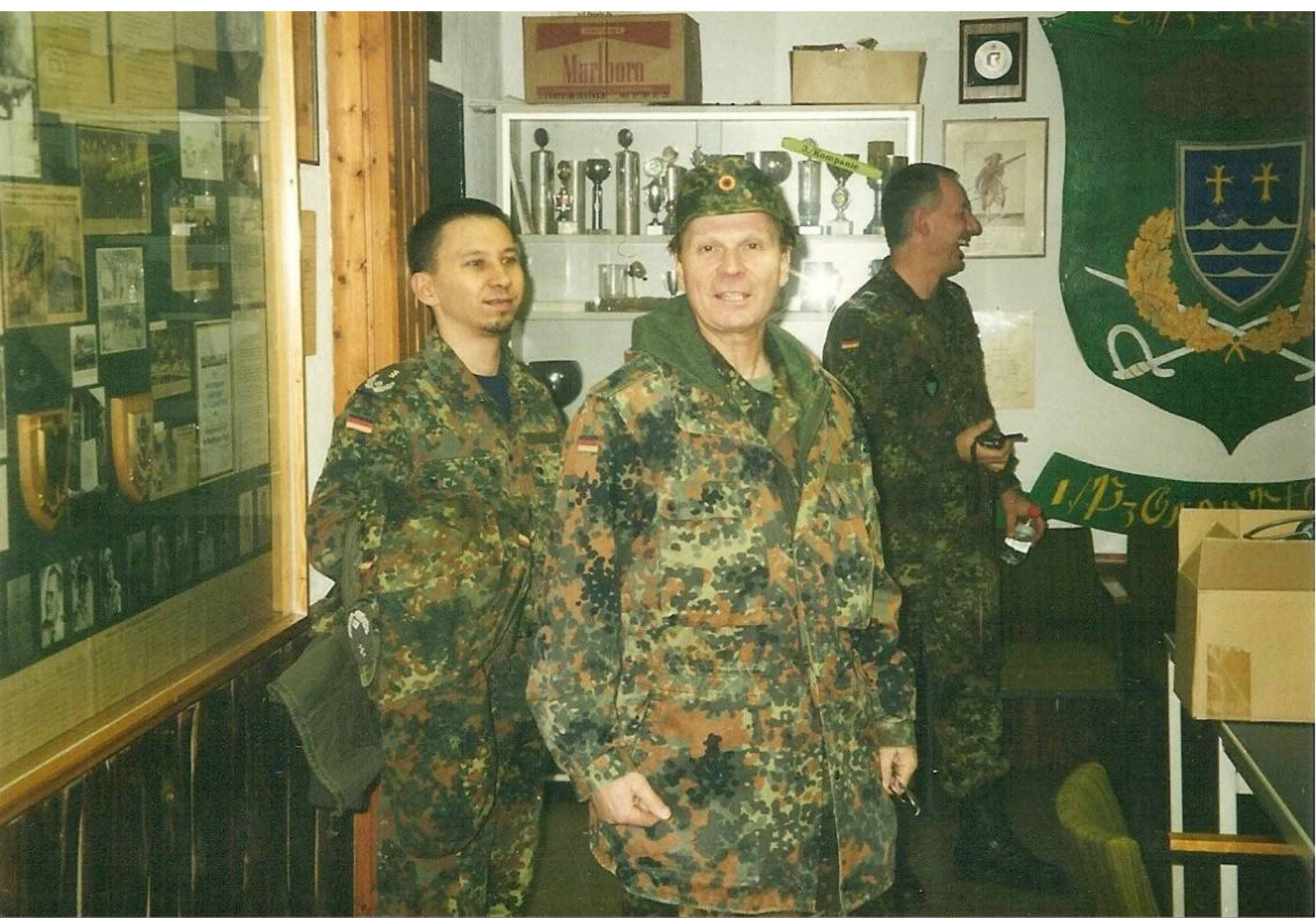
Eintreffen und Anmelden