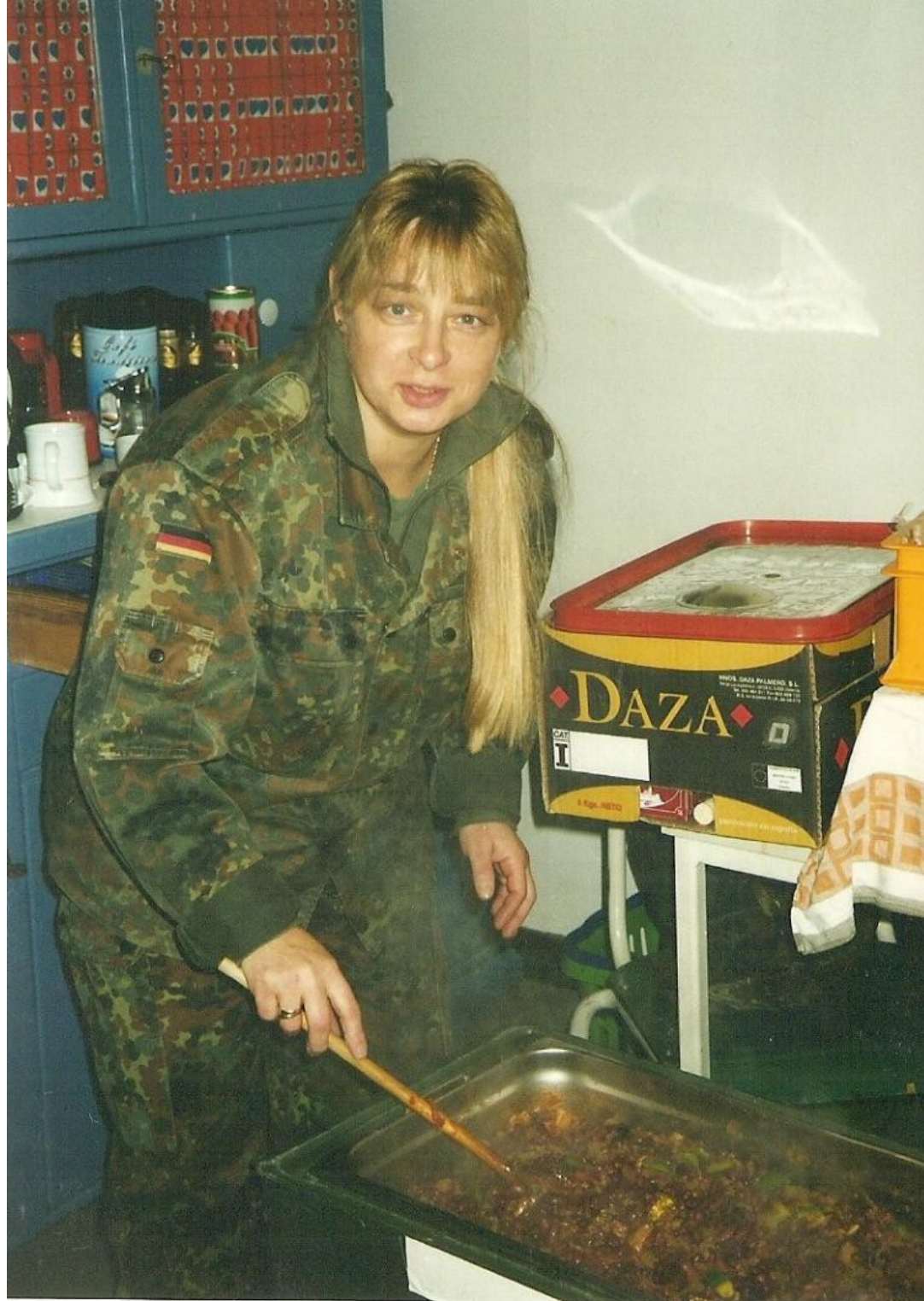
"Ohne Mampf kein Kampf"