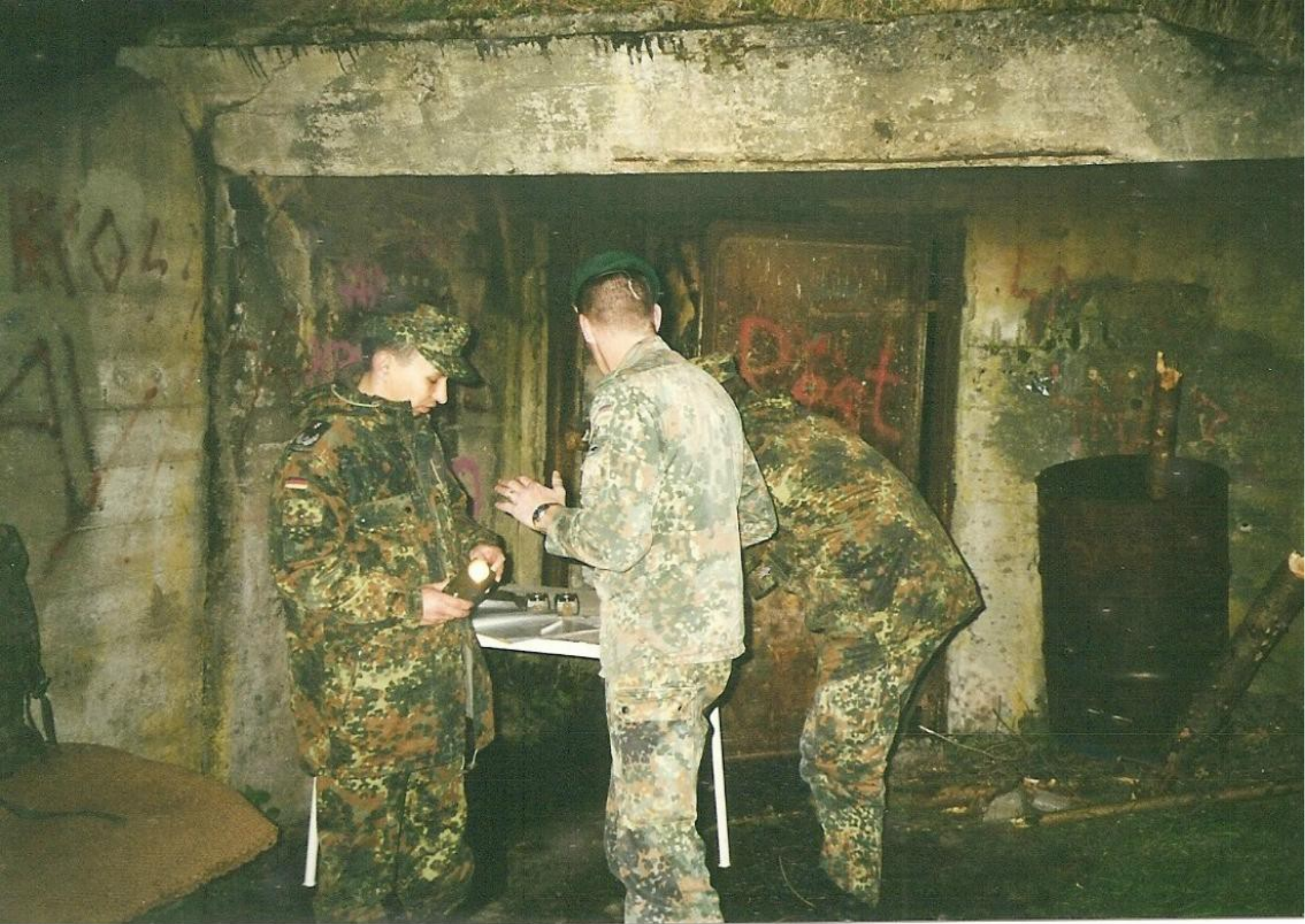
Ausgabe von Taschenlampen